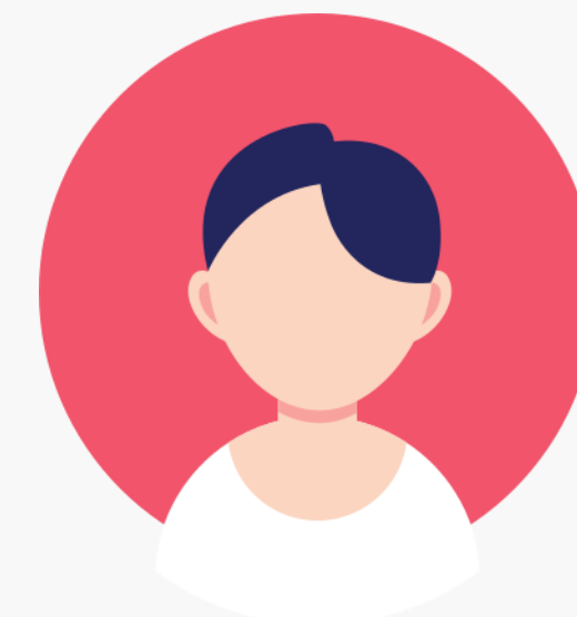
ПЫРКОВА О.С АДМИНИСТРАТОР